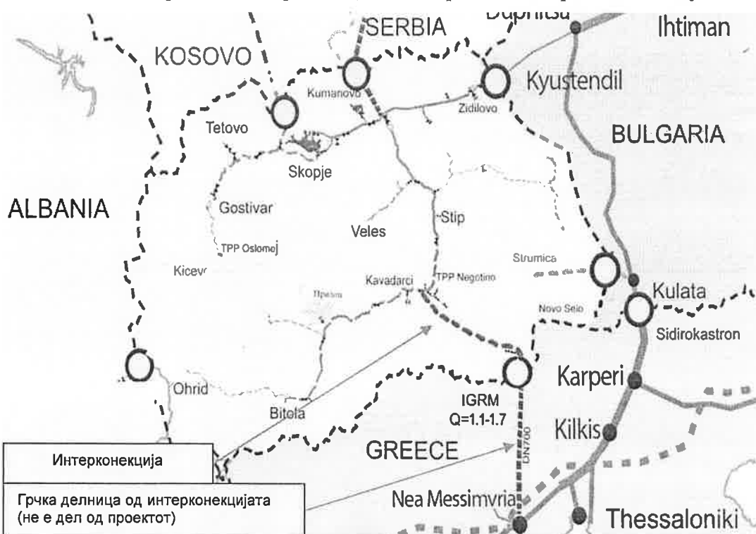
Слика 2. Карта на интерконекциската траса на Северна Македонија

Извор: Прилагодено од Националната стратегија за гасификација на Република Македонија, Министерство за економија, Република Македонија. 2018 година 14 .